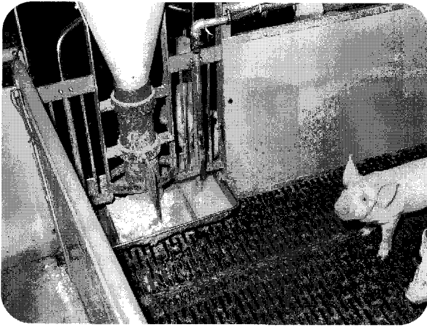
▲대부분의 사육농장에서 급수시설로 돈방당 니뿔 1개에 의존하고 있으나, 과잉 급여되고 있는 사료량을 물로 보충할 수 있는 충분한 급수시설을 설치하여 사료의 허실을 줄일 수 있는 방안을 강구해 볼 필요가 있다.