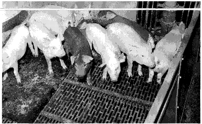
▲3월에는 더욱 차단 방역을 강화하여 마지막 기승을 부리는 PED를 끝까지 차단해야 한다.

또한 호흡기 질병을 수직 감염하는 것을 예방하기 위해서 모든에 항생제를 첨가하는 것도 하나의 방법이다. 농장에 맞는 항생제를 전체 모든에 1주일 정도 첨가하여 준다.