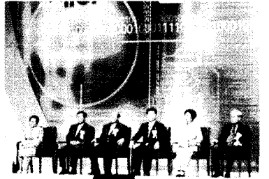
▲ 지난해 열린 제37회 발명의 날 기념식. 발명 유관단체장들이 참여한 가운데 성황리에 치러졌다.

특허청은 서른여덟번째로 맞이하는 오는 5월 19일 발명의 날을 기념하기 위해 ‘제38회 발명의 날 기념식’을 개최하고, 5월 한달 동안 다양한 발명행사를 개최함으로써 범국민적인 발명승상 의식의 확산과 발명을 생활