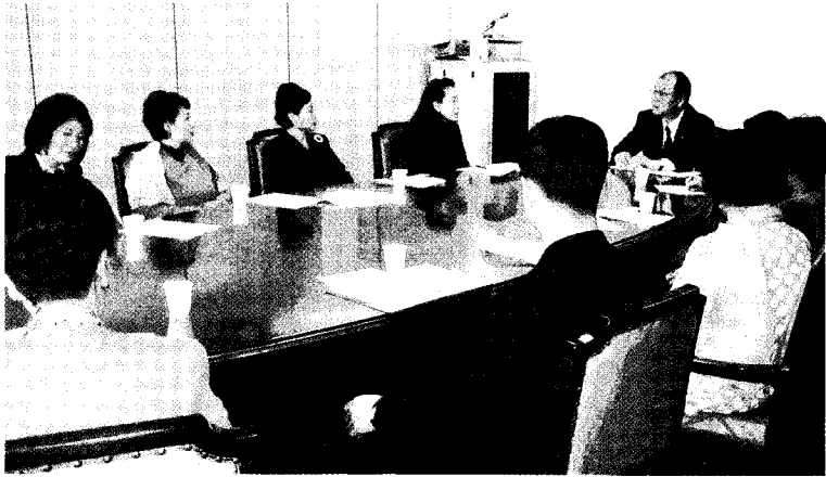
▲ 지난달 18일 특허청 서울사무소에서 하동만 특허청장과 한국여성발명협회 임원들이 자리를 함께한 가운데 협회의 원활한 사업진행을 위한 간담회가 열렸다.

특허청(특허청장 하동만)은 지난달 18일, 유관단체와의 간담회를 마련했다. 한국여성발명협회, 한국발명진흥회, 한국특허정보원 등 특허청 유관단체의 단체장들 비롯한 임원들이 참석한 가운데 특허청장과 대화의 장을 마련함으로써 더욱 내실있는 특허행정과 실질적인 업무 추진에 박차를 가하는 기회를 마련한 것이다.