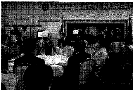
◀ 한국여성발명협회 '발명하는 사람들' 창간 기념식. 김광림 특허청장과 허은나 국회의원을 비롯한 많은 내빈들과 회원들이 모여 발명하는 사람들의 창간을 축하했다.