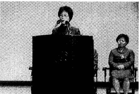
◀ 여성 발명가들의 우수한 사례들을 모아 선정하고, 발표할 수 있는 기회를 가졌던 '제8회 여성발명 우수사례 발표회'.