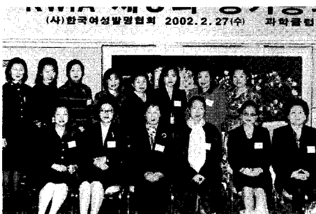
◀ 2002년도 한국여성발명협회 모든 사업을 계획했던 '제3회 정기총회'. 한 해 동안 협회를 최선을 다해 이끌겠다는 다짐으로 협회 임원들이 한자리에 모였다.