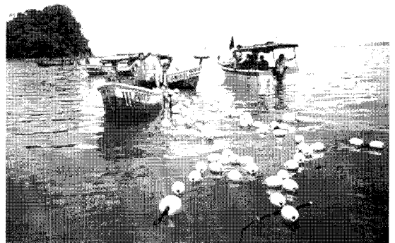
〈사진-2〉 해외기술지도사업(코스타리카에서 정치망의 설치모습) 2001년도