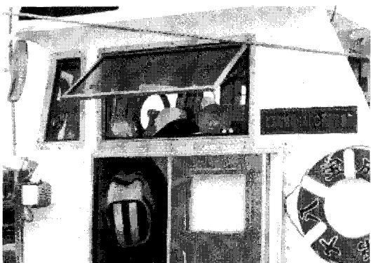
〈사진-3〉 교토성모학원 초등학교의 어항견학