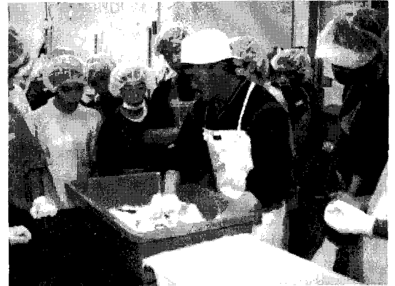
〈사진-4〉 이쿠라 만들기 체험