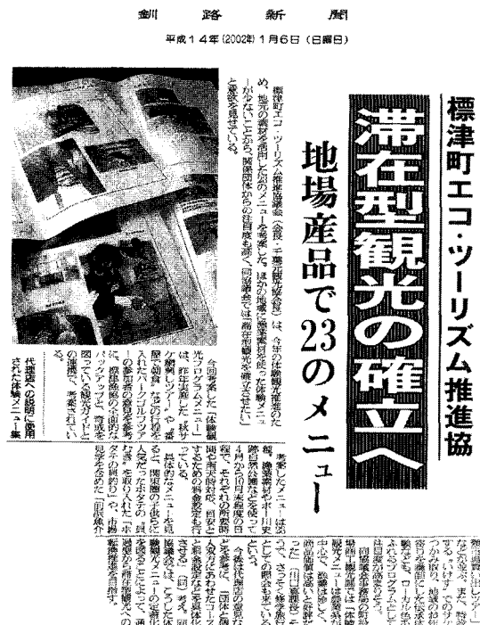
〈자료-1〉 시베츠정 체험프로그램의 신문기사

이 결과에 의해서 먼저 관광지라고 부르기도 하는 체험학습으로서의 사회학습이나 학교교육의