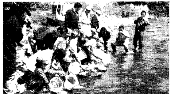
〈사진-5〉 방류사업 체험