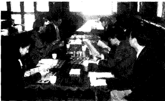
〈사진-3〉 추진원의 시찰연수 오시마(渡島) 지청관내 시찰