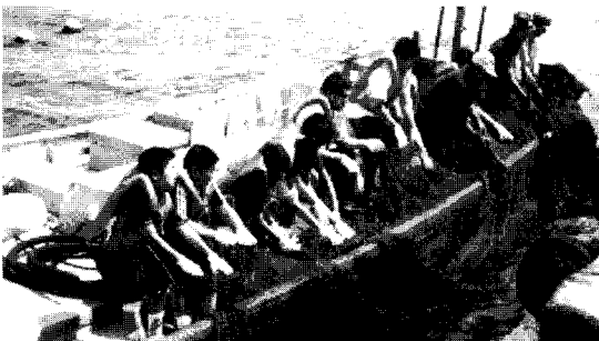
〈사진-4〉 그물 일으키기 체험

이때까지의 경험을 살리기 위해서 후카우라정의 대처로서 어촌에 살면서 실제로 어업에 접촉할 기회가 적어 생선에 대하여 알아야 될 것이 많이 있어도 좀처럼 그 기회가 오지 않는 어린이들에게 체험학습 등을 통하여 자신들 가까이 있는 후카우라정의 수산업에 대하여 학습하고 장래의 어업후계자 등의 육성을 꾀할 목적으로 한 사업을 2002년 12월 「후카우라 마린키즈」라는 명칭으로 출발하였다. ㉠