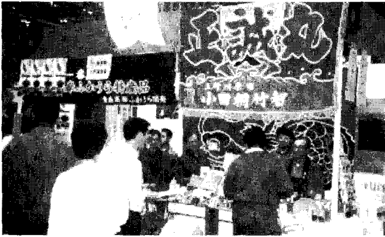
〈사진-2〉 지만시 마쿠하리 멧세