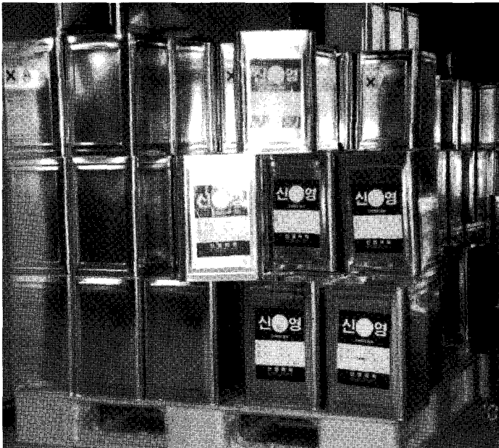
▲ 신영화학 생산제품인 그라비아 잉크

현재 35~6개 업체와 거래를 하고 있는 신영화학은 PVC 필름 규제 이후 대체 필름으로 시도되고 있는 OPS 원단의 애로사항(후가공)을