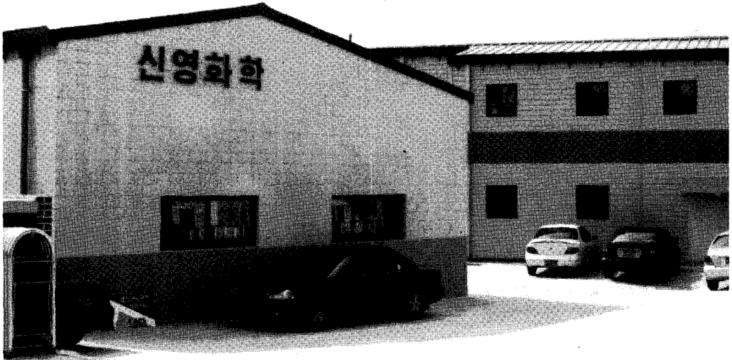
▲ 경기도 김포로 공장을 이전한 신영화학