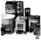
(그림 2) 일본 UV잉크 시장규모(1999년)