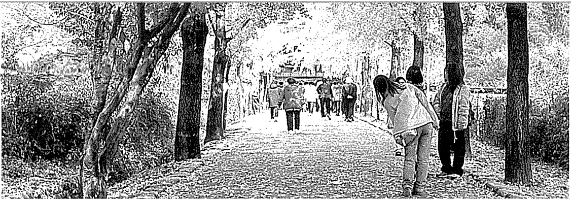
부석사 - 은행나무길

분위기를 온몸으로 느끼고 싶다면 이 길을 한번쯤 거닐어 볼 일이다. 영화에서나 나올 직한 수채화 같은 정경이 당신의 마음을 환상으로 데려다 줄 것이기 때문이다. 노란 은행나무길은 10월 중순에서 11월 초순까지 절정을 이룬다.