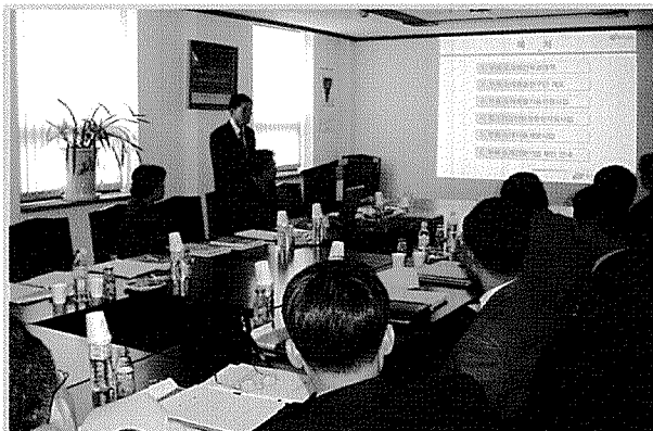
부품·소재통합연구단과 전기기기 부품· 소재 전문기업 육성을 위해 열린 업계와의 간담회(2003. 10. 15)