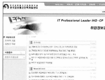
▲ 사이버 채용박람회가 열릴 한국정보통신인력개발센터 취업정보관 사이트