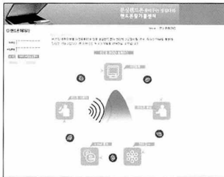
▲ '핸드폰 메아리 서비스' 홈 페이지