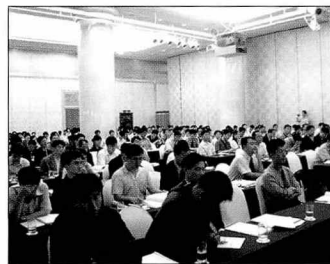
▲ 디지털홈 포럼에 참석한 관중들