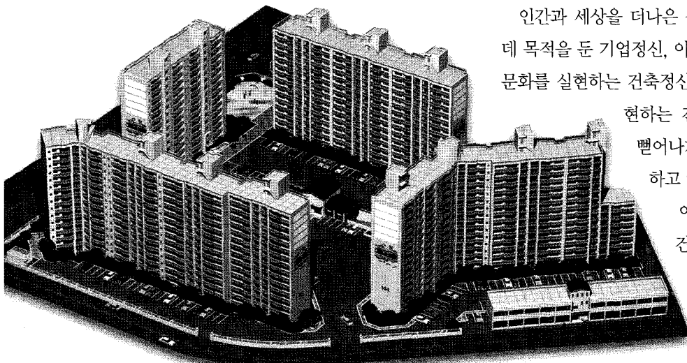
옥동 세영 두레마을 조감도

인간과 세상을 더 나은 삶의 터전으로 가꾸어 가는데 목적을 둔 기업정신, 아름다운 환경과 건강한 건축문화를 실현하는 건축정신, 자연과 인간의 교감을 표현하는 건축미학, 미래 지향적으로 뻗어나가는 기업의지로 더욱 발전하고 앞서가는 세영종합건설(주). 이러한 기업정신, 건축정신, 건축미학, 기업의지의 꾸준한 실천과 노력으로 주택건설업계에 우뚝선 세영의 모습을 곧 볼 수 있을 것이다. ㊦