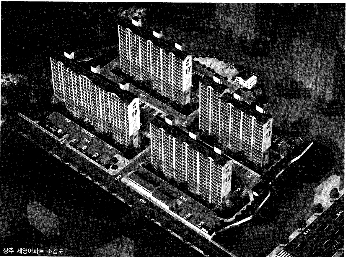
상주 세영아파트 조감도