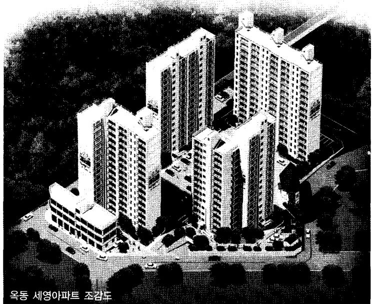
옥동 세영아파트 조감도

또한 살면서 더욱 만족을 느끼게 하는 입주자 관리 시스템이야말로 세영의 첫 번째 자랑거리이다. 세영은 전 공정에 걸친 빈틈없는 책임시공, 고객품평단 제도, 사내 중간준공검사는 물론 입주자가 직접 점검하는 사내 품질제도, A/S센터운영 등으로 가장 살기 좋은 아파트를 만들고 있다.