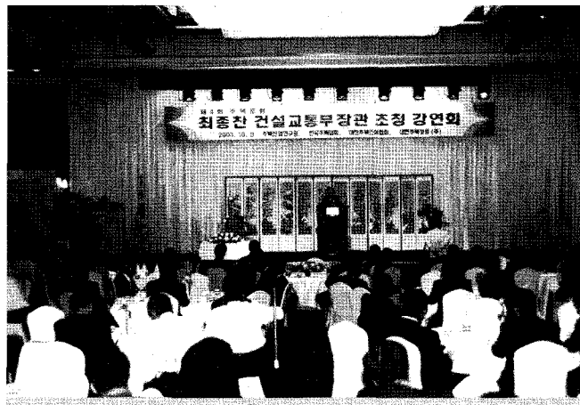
▲ 최종찬 건설교통부장관이 강연하고 있는 모습

그리고 주택건설업계에서는 ‘주택분양가 원가 내역 공개 의무화 반대’ 및 ‘9·5 재건축시장 안정대책 중, 1:1 재건축의 경우 중·소형 의무건설 비율 적용 제외’ 등을 건의하였다.