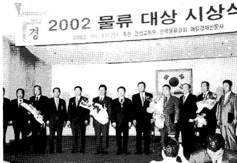
▲ 2002년도 물류대상 수상업체

오는 10월 15일부터 18일까지 4일간 코엑스 인도양홀에서 진행될 이번 행사의 전시품목은 종합물류시스템, 물류ASP, 바코드 시스템, 무선데이터 통신, 위치정보시스템(GPS), 화물추적시스템, 사이버 물류시스템, 파렛트풀 시스템, 자동창고, 수직반송시스템, 운반용기, 분류기기, 입출고 및 재고 관리시스템, 항만하역 시스템, 자동포장시스템, 물류아웃소싱, 화물터미널, 물류관련 서적 및 잡지 등등이 전시된다.