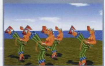
(그림2) 모션 캡처된 데이터

키 프레임 애니메이션은 조작해야 할 대상의 수가 증가하면 수작업의 양도 그에 비례해 늘어나게 되므로 많은 자유도를 가지는 인간의 움직임을 실시간에 제어하기란 거의 불가능하다. 이런 문제를 해결하기 위해 최근 사용되고 있는 '동작 캡처 기술'은 3차원 캐릭터 애니메이션 제작시 거의 필수적인 요소로 등장하고 있다. 이는 추적기(tracker) 또는 위치 및 자세 센서를 인간의 몸에 부착해 공간 이동과 자세 변화에 대한 정보를 직접 기록하는 기술로 각 센서별로 매순간