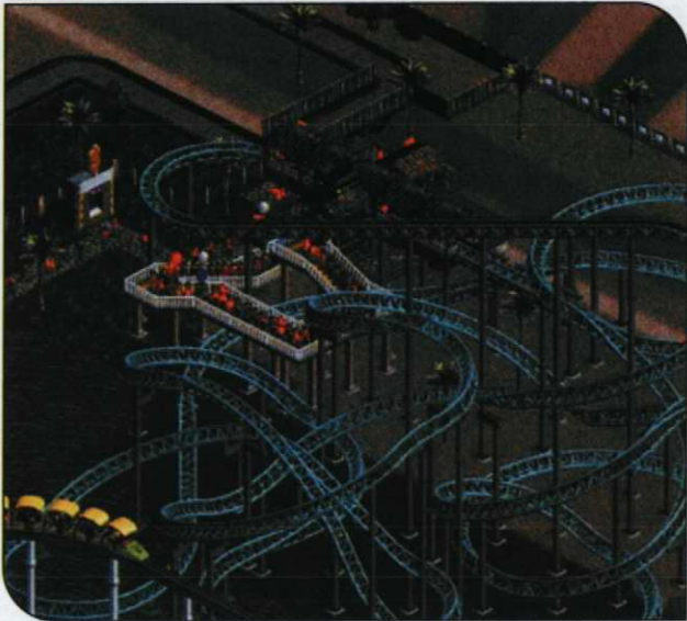
게임 디자인은 여러 가지 면에서 위 아래로 갑작스레 움직이고 빠르게 회전하는 롤러 코스터와 비슷하다

보다 어렵다. 비어 보이거나 평범하게 보이는 화면을 피하고자 한다면 게임의 화면은 실제 세계의 환경보다 흥미로워야 한다.