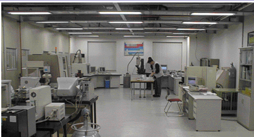
연구소내 사무실 전경(왼쪽)과 분석실 전경

2002년 대통령 표창장 등을 받았다. 또 품질시스템 분야에서도 1997년 ISO9002, 1998년 ISO9001과 QS9000을 획득하는 등 연구력을 뒷받침한 성장세는 지금도 계속되고 있다.