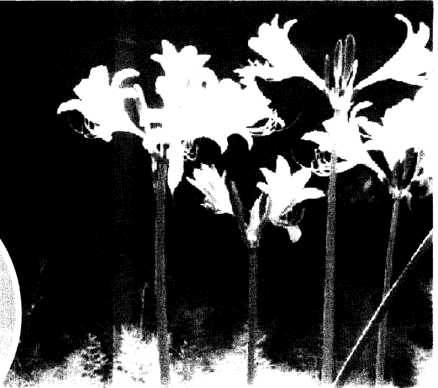
▲ 상사화 전경

구조적으로 꽃과 잎이 서로 만날 수 없는 운명을 타고난 식물, 그래서 이 식물의 이름도 相思花다. 영명은 'Magic Lily'라고 하며, 꽃말은 '그리움', '변함없는 사랑'이다. 상사화 꽃이 금년엔 예년보다 약 10일정도 빨리 피고 있다.