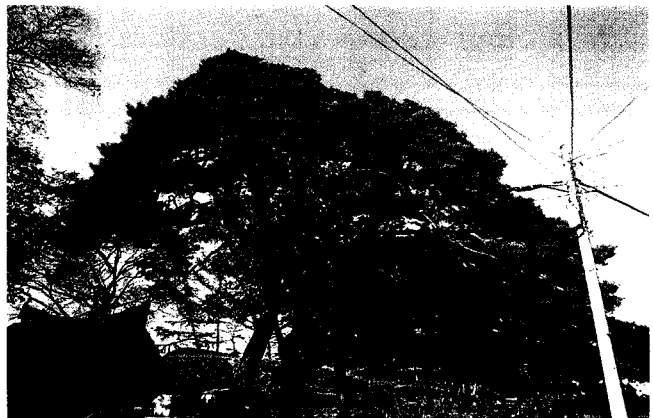
▲ 전북 남원 보절 진기리 소나무