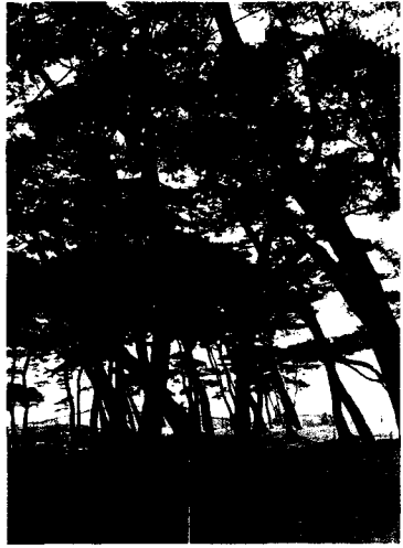
▲ 부안군 변산 도청 모향부락 소나무(90.1.2)

나무를 벤 자는 장 100대의 벌을 가하며, 만일 그 남편되는 사람이 관리이면 파직시키고 한산(閑散)이면 외방으로 보내고 평민은 장 80에 징속을 한다. 도성 내외사산은 한성부의 낭관이 수시로 검찰해서 매달 보고를 하고, 이러한 검찰을 게을리 하면 해당관리는 강등을 시키고 산지기는 장 100대로 징치한다는 등 금제규정이 엄격하였다.