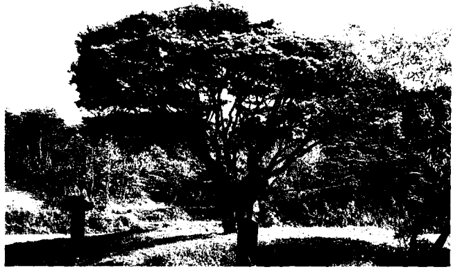
▲ 전북 남원, 보절, 진기리 반송, 타막솔

소나무를 금양할 것이 언급되고 있다. 이처럼 조선시대에는 숲을 보호하고자 한 노력은 있었으나 정치 및 사회의 기강이 해이해져 있어 그 규정이 실효를 거두지 못하였다. 규정이 엄하기만 하면 된다는 생각은 잘못이었는데, 가령 정약용이 지은 <승발송행 僧拔松行>이라는 시는 나무를 심어 좋은 소나무 숲을 사양한 중이 수영소교(水營小校)로부터 무례한 행패를 당하고 그가 심은 어린 소나무를 모조리 뽑아서 앞날의 우환을 미리 막는다는