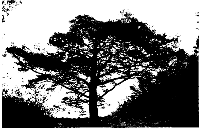
▲ 영풍 입석의 소나무, 천기물 383호

“각도의 황장목을 키우는 봉산에는 경차관을 파견하여, 경상도와 전라도에서는 10년에 한번씩 벌채하고 강원도에서는 5년에 한번씩 벌채하여 재궁(梓宮)감을 골라낸다.”라고 규정하고 있는데 대상수종은 소나