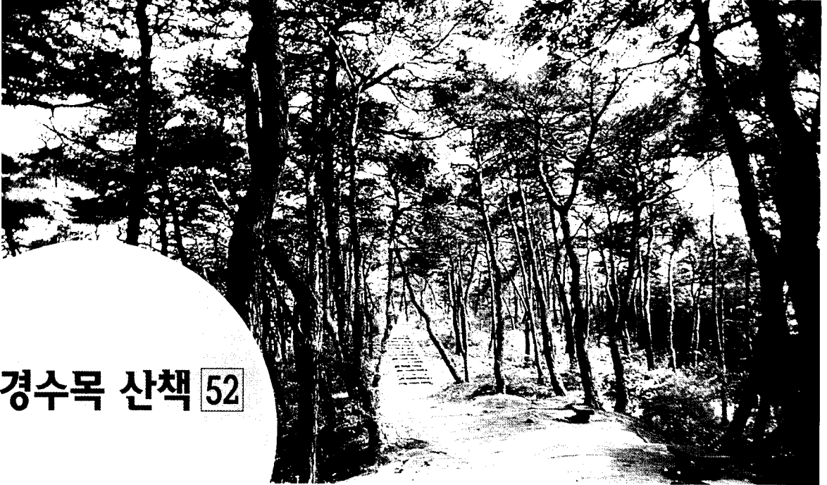
▲ 고창 모양성의 소나무