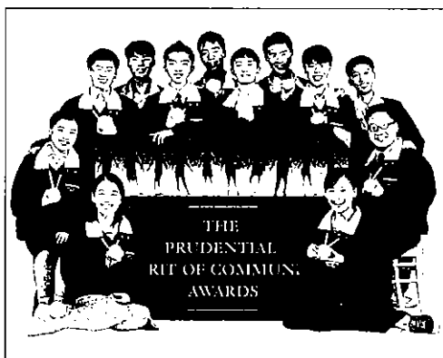
▲ 2002년 제 4회 전국 중·고생 자원봉사대회 친선대상 및 금상 수상자 12명

전국 중·고생 자원봉사대회는 자발적으로 봉사 활동을 벌이고 있는 전국의 모범 중·고등학생들을 발굴하고 시상하는 프로그램이다. 1999년부터 시작되어 현재까지 약 4만5천여 명의 중·고등학생들이 참여해 수상자 수가 1000여 명에 이르고 있는 이 대회는 푸르덴셜이 한국중등교장협의회, 한국청소년개발원과 함께 진행하고 있으며 교육인적자원부, 문화관광부, 한국대학교육협의회, 그리고 한국청소년단체협의회의 공동 후원으로 진행되고 있는 국내 최대의 청소년 자원봉사자 시상 프로그램으로 자리매김하고 있다.