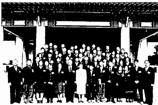
▲ 이희호 전 영부인의 격려 다과회에 참석한 1999년 1회 수상자들

통해 학생들에게 "자원봉사의 영역이 이렇게 다양하구나." 라는 인식을 심어주는 데 기여하고 있다.