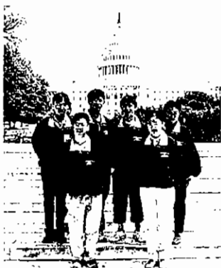
▲ 2002년 5월, 미국 푸르덴셜 중·고생 자원봉사대회에 참가한 한국(앞줄), 일본, 대만 친선대사들

수상자는 중앙예비심사, 16개 시도 지역심사, 중앙심사 등 3단계의 엄정한 과정을 통하여 선정된다. 1차 중앙예비심사에서는 모든 응모신청서를 전국 공통으로 심사하여 지역 심사대상자를 선정하고 지역심사에서는 서면뿐만 아니라 면접을 통하여 학생들의 면면을 심사하는 과정을 거치고 있다. 특히 지역심사는 각 지역의 수상자들이 한 자리에 만나 정보를 교류하는 장으로도 활성화되고 있어 지역심사 후 모임을 갖는 등 청소년들의 적극성을 엿볼 수 있다.