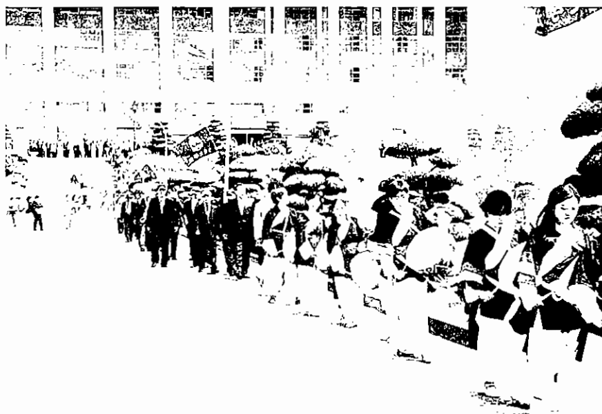
▲ 49주년 인하 발전 한마당

교류대학과의 교류협정을 통한 해외 유학 및 연수 제도 등도 대폭 확대해 나갈 예정입니다.