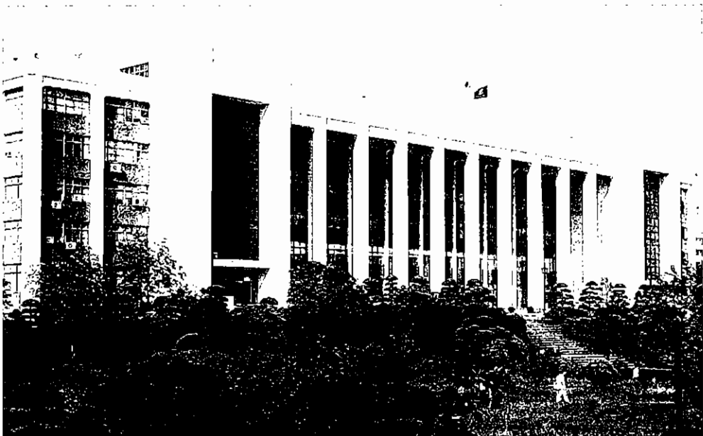
▲ 인하대학교 본관

인하대는 평소 대학에서 터득한 지식이 사회와 기업에서 바로 적용될 수 있도록 대학 중심의 교육 시스템을 강화하고 있습니다. 하이테크 기술을 교육하여 산업체가 필요로 하는 ‘맞춤형 인재’를 배