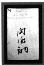
● 연세대 동원의학박물관에 보관된 민영익(閔泳湖·1860~1914)의 명함으로 1893년 조선보빙사 자격으로 구미 순방 때 사용했다.