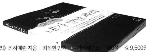
《온쪽이 하에린의 내가 만난 파리》 최하에린 지음 | 최정현 만화 | 디자인하우스 | 180쪽 | 값 9,500원