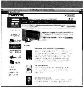
www.tmecca.co.kr 티메카의 홈페이지 화면.