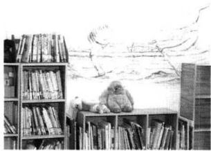
동화 속 그림으로 벽면을 꾸민 웃는책.