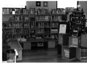
어린이 눈에 맞춘 숲속작은도서관의 책꽂이.

부모님, 학생들이 게릴라식으로 꾸미는 자생적인 공간. 내 집 놀이터처럼 편안하고 즐겁게 책을 만날 수 있는 아이들의 쉼터. 어린이도서관은 내 집 같은 편안함과 자유로움 속에서 책을 만나는 여유를 선사하는 아이들의 건전한 놀이터로 거듭날 것이다. ☞