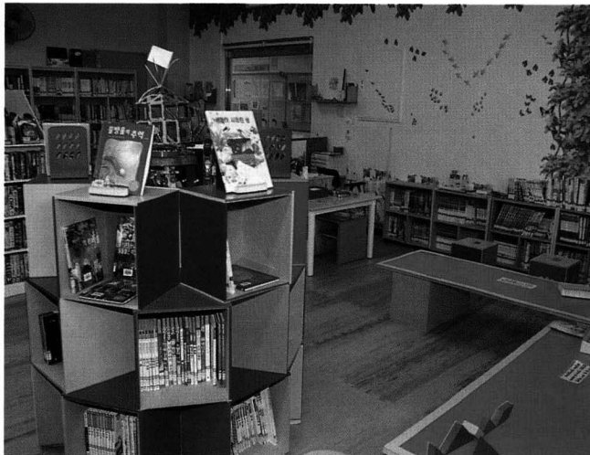
일산 신도시 저동초등학교 앞 밤가시마을에 있는 숲속작은도서관.