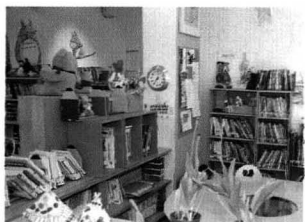
상상력과 호기심을 키워주는 웃는책.