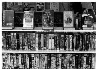
숲속작은도서관의 미디어교육 자료들.