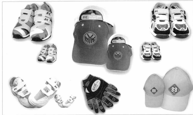
◆ 삼양산업에서 생산하는 입체라벨을 부착한 제품들

질의 액체를 만드는 과정까지는 동일하지만 그동안 이 고무소재에 인쇄가 되지 않았던 것을 인쇄가 가능하도록 특수잉크를 사용한다는 것이 다른 점이다.