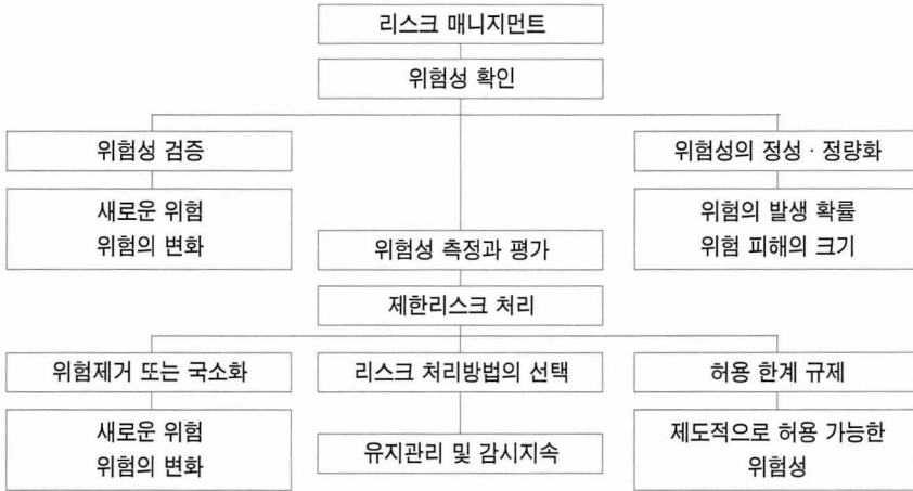
[도표 2] 리스크 매니지먼트의 방법