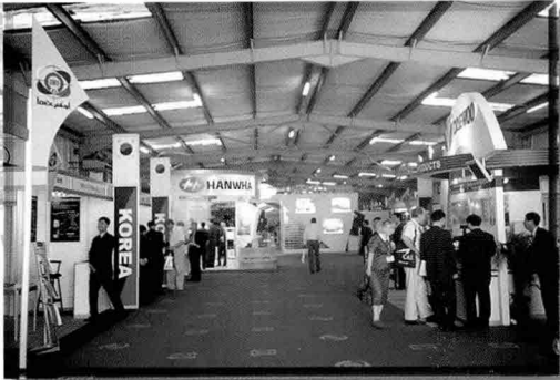
▲ 한국관 실내 부스의 모습

▼ UAE를 비롯한 다수 국가의 방산관련 인사들이 향후 방진회를 통한 한국 방산업체와의 협력의사를 표명하였다.