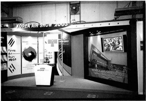
▲ 11월 4일부터 9일까지 부산에서 개최되는 코리아 에어쇼 홍보 부스

▼ 한국관 중 가장 넓게 전시장을 운영한 기아자동차는 현지 3개 방송사에서 출품소식이 방영되고 지역신문 1면 톱기사로 소개되었다.