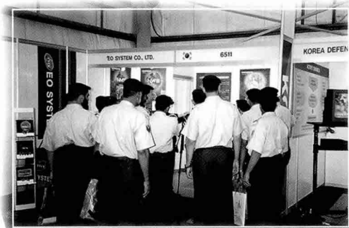
▲ 중동지역 무기 담당자들이 다수 방문하여 열영상조준경, 야시장비에 많은 관심을 나타내고 수출 가능성 등의 의사를 타진한 이오시스템