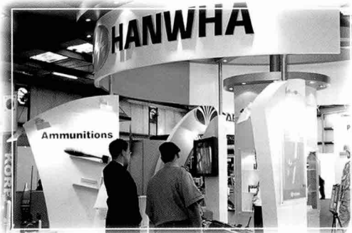
▲ 말레이시아, UAE, 요르단 및 아프리카 지역 참관단 등이 박격포탄, 고풍탄, 40mm 유탄, 수류탄, 신관 등에 많은 관심을 나타낸 한화 부스