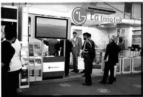
▲ 말레이시아 육군 총장이 KP-SAM을 직접 조작해 보는 등 UAE, 오만, 예멘 참관단이 무전기 등 통신 장비에 많은 관심을 나타낸 LG이노텍 부스

▼ 대우중합기계와 대우인터네셔널 공동 운영부스에서 각국 군담당자들이 잠수함, 기관총, 소총 및 데모진압 장비에 구체적인 관심을 표명하였다.