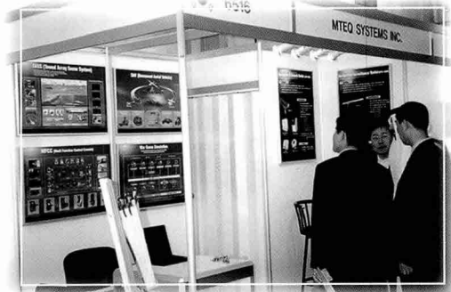
▼ UAE는 공군 무인항공기용 통신장비 및 해군 예인식 음파탐지기에 말레이시아는 연안방어 레이더에 지대한 관심을 표명한 엠텍 부스