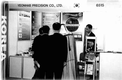
▲ 터키, 러시아, 파키스탄 참관단이 케이블 어셈블리 등에, 중동지역 무기관계자는 VTC-9K 통신기의 판매추진 의사를 표명한 연합정밀 부스