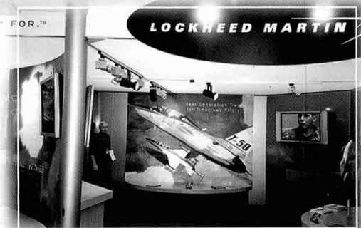
▼ 록히드 마틴 부스에 모형이 소개된 T-50 골든 이글