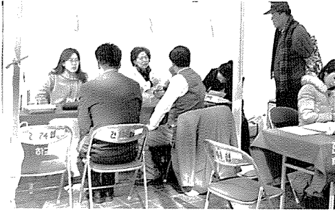
▲ 대구지부는 아동복지시설인 육영학사, 새병원, 희망의 집 외 5곳 등 원생 및 노숙자 320여명에게 무료건강검진을 실시했다.

지난 2월 한달 동안에도 5천 5백여명에게 무료건강검진과 건강상담을 실시하여 아름다운 만남을 실천하였습니다.