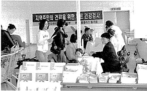
▲ 경북지부는 김천소년교도소 등 교도시설재소자 및 일반주민 680여명에게 무료건강검진을 실시했다.