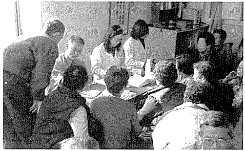
▲ 강원지부는 대마보건진료소, 신천보건진료소 외 3곳 등 오백지 주민 90여명에게 무료건강검진을 실시했다.