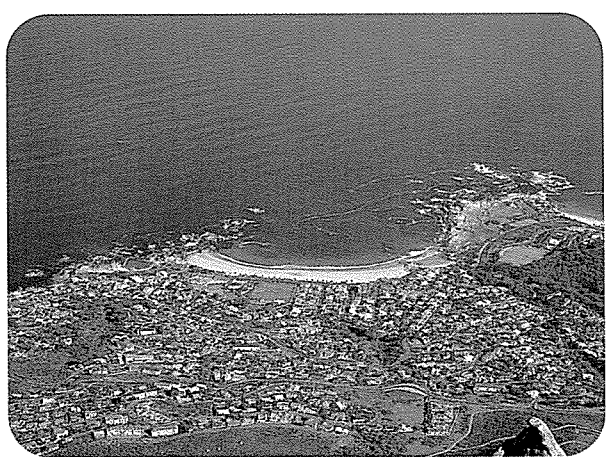
▲ 테이블 산(마운틴)에서 내려다 본 바다를 낀 케이프타운 주거지 모습

유럽보다 더 유럽다운 도시라는 케이프타운은 흔히 mother city(어머니의 도시)라고 불린다. 남아공의 많은 도시 가운데 가장 남서쪽 끝에 자리한 케이프타운은 아름다운 자연경관을 자랑한다. 케이프타운에는 유명한 희망봉 외에도 테이블마운틴, 물개섬, 펄턴섬, 로벤섬 등 볼거리가 널려 있다.