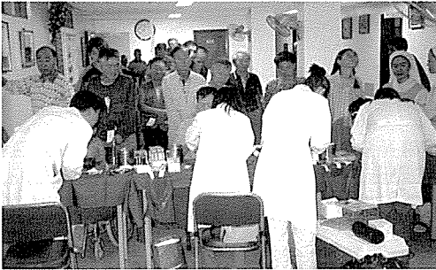
▲ 서울지부는 저소득층 주민, 일반주민, 중식지원학생 270여명에게 무료건강검진을 실시했다.

한국건강관리협회는 봉사와 희생을 실천하고 있습니다. 지난 8월 한달 동안에도 5천 2백 여명에게 무료건강검진과 건강상담을 실시하여 아름다운 만남을 실천하였습니다.