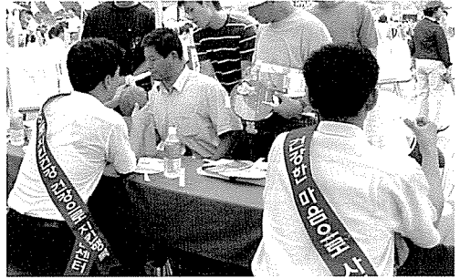
▲ 대구지부는 노인복지시설인 청곡사회복지관, 아동복지시설인 학생수련원 등 원생 및 일반주민 660여명에게 무료건강검진을 실시했다.