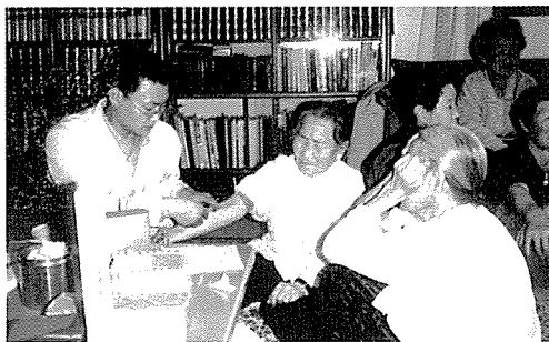
▲ 전북지부는 아동복지시설인 전주영아원 등 원생 및 일반주민, 오백지주민 100여명에게 무료건강검진을 실시했다.