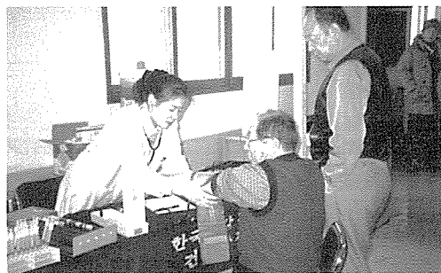
▲ 인천지부는 노인복지시설인 정보통신교육원 원생 80여명에게 무료건강검진을 실시했다.