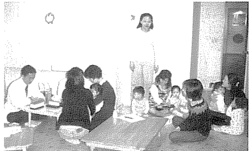
▲ 전북지부는 일반주민 1,300여명에게 무료건강검진을 실시했다.