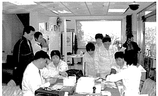
▲ 광주·전남지부는 무안군장애인복지관, 주암호수주변, 두암중학교 외 50개교 등, 장애인 및 주민, 학생 2,100여명에게 무료건강검진을 실시했다.