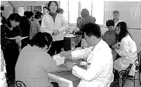
▲ 강원지부는 구절분교 외 1개교 등 중식지원학생 150여명에게 무료건강검진을 실시했다.