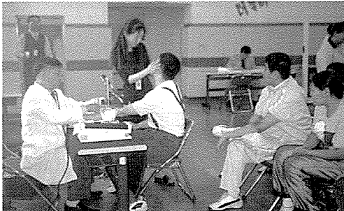
▲ 인천지부는 장애인복지시설인 남동구장애인복지회관 등 원생 30여명에게 무료건강검진을 실시했다.