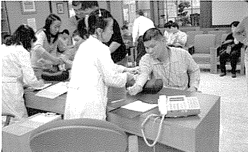
▲ 서울지부는 하이서울축제 참가자, 장애인복지시설인 교남소망의 집, 대안고·경성중 외 3개교 등 일반주민 및 원생, 중식지원학생 3900여명에게 무료건강검진을 실시했다.