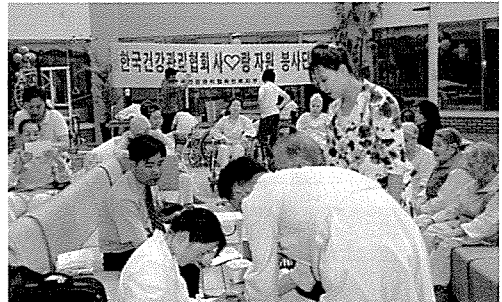
▲ 전북지부는 기초생활보장수급권자, 노인복지시설인 군산보은의집, 군산고등학교 외 31개교 등 일반주민 및 원생, 중식지원학생 1,030여명에게 무료건강검진을 실시했다.