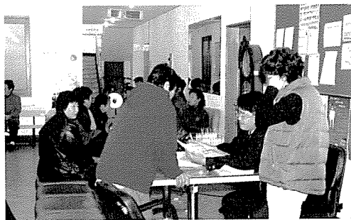
▲ 제주지부는 제주시보건소, 북제주군보건소 등 기초 생활보장수급권자, 오백지 주민 80여명에게 무료건강검진을 실시했다.