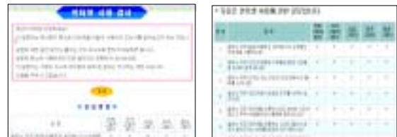
[그림 1] 온라인 설문 시스템 화면의 예

본 연구는 또한 인터넷 중독 측정을 위하여 온라인 설문 시스템을 구축하여 온라인 상에서 설문 조사를 실시하였다. 온라인 설문 시스템 화면의 예는 [그림 1]과 같다.