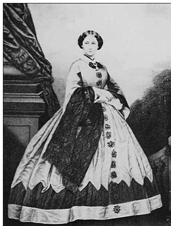
<그림 1> 1862년, 솔과 동형의 크리놀린 드레스.

문학작품 「바람과 함께 사라지다」에서는 Scarlett and Melanie 상반되는 두 인물의 이미지를 의상의 형태, 소재, 색채를 통해 표현했다. 의상의 형태 면에서는 Scarlett은 당시의 유행에 민감한 인물로 표현되고 있다. 당시 미국의 여성들은 최신 프랑스 모드를 따랐으며 Scarlett 역시 그 유행을 쫓았다. 또 Scarlett은 전통사회 질서에 따르기보다는 자신 의지대로 의상을 입기도 하였다. 그 예로 낮에 열리는 파티에서는 어깨를