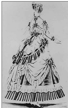
<그림 2> 1867년, 리본장식을 한 플로네즈 스타일 드레스. (출처: Racinet, A., Histoire du Costume, 1995.)