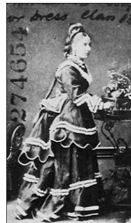
<그림 3> 1873년, 버슬 드레스. (출처: Levitt, Sarah, Victorians Unbuttoned, 1986.)