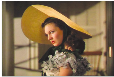
<그림 4> 소매와 가슴부분에 러플을 잡은 드레스와 커다란 밀짚모자.