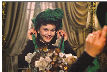
<그림 8> 검은 상복 드레스와 녹색 본넷.