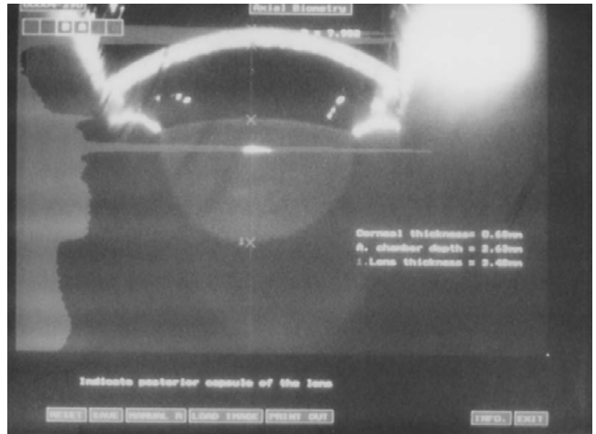
Fig. 4. Slit-lamp examination shows packed corneal cystine crystals.

은 2.5세였으며, 손목 방사선 검사에서는 활동성 구루병의 소견이 관찰되었다(Fig. 2). 심초음파에서는 좌심방과 좌심실의 확장, 좌심실의 확장기 기능 감소가 관찰되었다. 안과 slit-lamp 검사에서 각막과 홍채 표면에 결정의 침착 소견이 관찰되었다(Fig. 3, 4). 시스틴-결합 단백질을 이용하여 측정한 환자의 혈액 백혈구 시스틴 함량은 8.4 nmol half-cystine/mg protein(정상:0.2 이하)이었다.