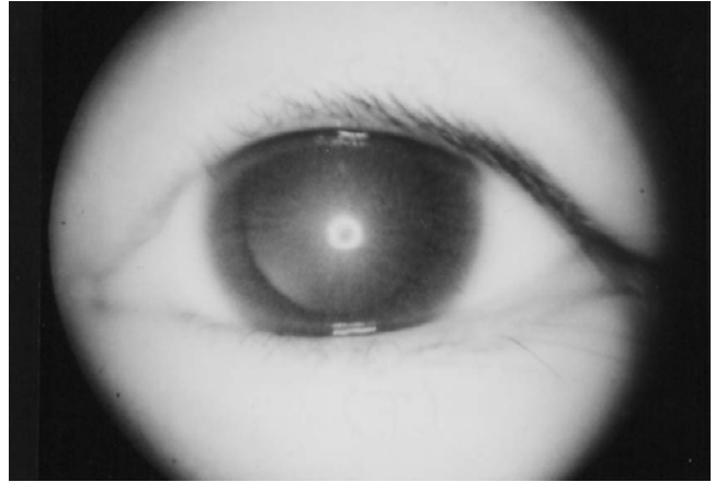
Fig. 3. An eye with abundant crystals in cornea and iris.

스분석은 pH 7.23, pCO 2 19.7 mmHg, pO 2 98 mmHg, bicarbonate 8.1 mmol/L이었다. 요검사에서 비중 1.010, 당 trace이었고, 단백뇨와 혈뇨는 없었다. 24시간 요량은 2,050 mL, 크레아티닌 청소율은 11.0 mL/min/1.73m 2 이었고, 요세관 인 재흡수율(tubular reabsorption of phosphate)은 80.4%이었다. 갑상선 기능 검사에서 유리 T 4 0.54 ng/dL, T 3 124 ng/dL, TSH 24.2 IU/L이었고, 1,25-(OH) 2 vitamin D 3 27 pg/mL이었다. 골연령