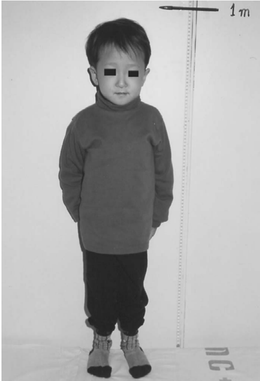
Fig. 1. A 12-year-old boy with short stature, poor muscle development, and protuberant abdomen.