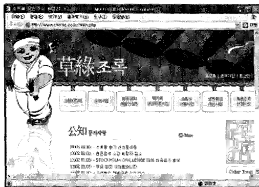
〈그림 1〉 초록 ( http://www.choroc.co.kr )

현재는 이반성면을 중심으로 동일 생활권 지역은 진주시 동부 5개면 지역까지 범위를 확장한 상태이며 각 면마다 정보센터를 운영중이다.