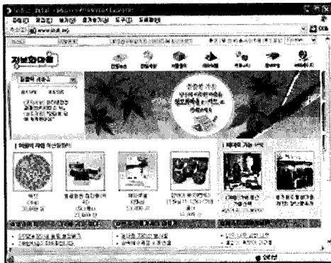
〈그림 2〉 인빌 ( http://www.invil.org )

이렇게 조성된 인터넷 환경 하에서 주민들이 실질적으로 혜택을 받을 수 있는 인터넷 서비스 개발하고 정보화 시범마을 공통 및 지역 특화 콘텐츠뱅크, 웹 포털 사이트, 전자상거래, 커뮤니티 서비스 제공하고 있으며 현재 인빌( http://www.invil.org ) 사이트를 서비스 중에 있다 (그림 2 참조).