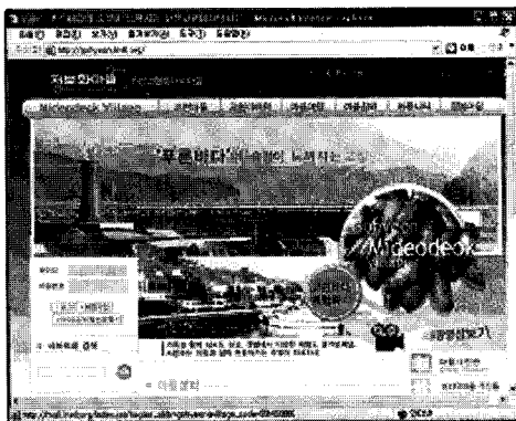
〈그림 3〉 고현 미더덕마을

이 연구에서는 103개의 정보화 시범마을 중 비교적 활발하게 사이트가 운영중인 마산시 고