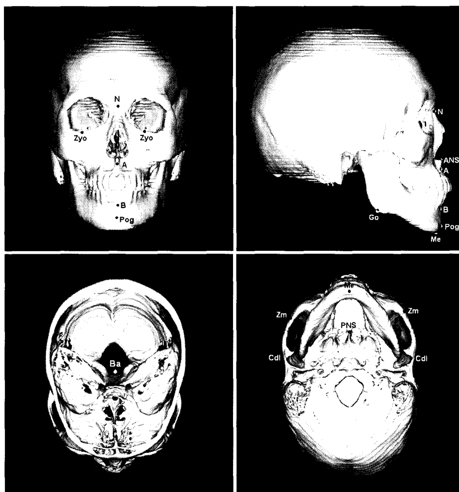
Fig. 1. Landmarks used in the study.