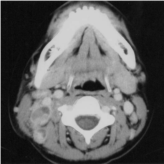
Fig. 3. Computed Tomography showing enlarged and encapsulated lymph node in the right cervical area.

급성 괴사성 림프절염(Kikuchi disease)으로 진단되어, 이후 항생제를 중단하였다. 제 21병일째부터 prednisolone(1 mg/kg) 경구 투여 후 발열이 소실되고 이후 1주일간 치료 후 경부 림프절의 크기도 점차 감소하여 퇴원하였다.