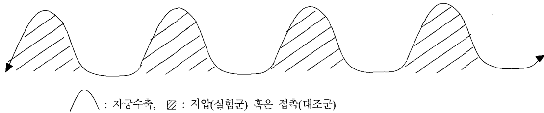
<그림 4> 삼음교 지압 방법