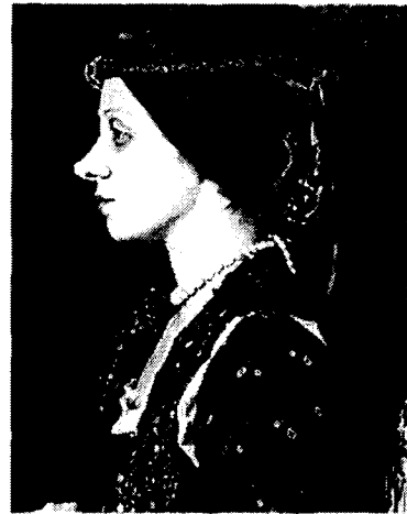
사진 3. 「Untitled」, 1989, 33×24inch 칼라사진

리티를 최대한 이용하기도 하고, 공략하는 전략을 택하고 있으며 사진조각이나 사진 인스톨레이션 또는 사진 퍼포먼스 등은 사진을 특수한 효과를 얻기 위한 수단으로 사용하고 있기도 하다. 이런 연출된 리얼리티를 사진이라는 가장 재현력이 강한 매체를 통해 표현하는 것은 종래의 사진문법을 의도적으로 해체하고 전혀 새로운 사진읽기의 틀을 요구하는 것이며, 사진과 리얼리티 사이의 이와 같은 새로운 긴장관계는 사진이라는 기호를 전혀 새로운 각도에서 바라볼 수밖에 없도록 만들고 있다.