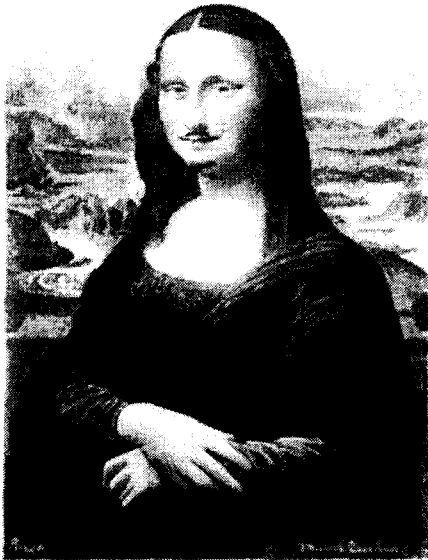
사진 2. 「L.H.O.O.Q」 1919, 19.4×12.2cm 연필과 레디메이드

1919년에 뒤샹은 레오나르도 다빈치의 「모나리자」를 프린트한 싸구려 그림엽서에다 코 밑 수염과 턱수염을 연필로 그려 넣고, 아래에 대문자로 「L. H. O. O. Q」라고 적어 넣었다. 이 철자를 붙여로 발음하면 L은 [e]로, H는 [a?]로, O는 [o]로, 그리고 Q는 [ky]로 발음되기 때문에, 이것을 합하여 발음되는 대로 빨리 읽으면 「elle a chaude au cul」이 된다. 이 말은 영어로 「she has a hot ass」라는 뜻이 되는데, 즉 「그녀는 화끈한 엉덩이를 가지고 있다」는 뜻이 되어 「모나리자」의 예술적 절대 권위를 조롱하는 듯하게 보인다. 콧수염과 턱수염을 그려 넣어 기존 작품의 우상타파적인 의도는 다다적 자극과 충격요법이다. 그가 조롱하는 것은 다빈치의 진정한 예술적 업적이라 아니라, 종교적인 부르조아 예술의 사원이 되어버린 프랑스의 루브르 박물관 안에서 이제는 무조건적으로 절대권위를 가지고 부르조아의 숭배대상이 되어버린 「모나리자」 회화 작품의 현실이다. 또한 평가체제의 확실성과 역사화를 통한 교육으로 이어지는 고전미에 대한 숭배를 비판하고 있다.