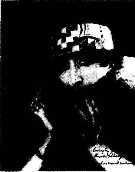
사진 1. 「로즈 셀라비」 1920-1921, 21.6×17.3cm

변기가 놓인 위치에 따라 변화하는 일종의 투명한 기호로 존재하듯이 자신을 하나의 변환적인 이동장치(shiftter)이자 고정되지 않은 기호로 인식하였다. 뒤상은 자신이 다른 오브제들처럼 내적으로 결정된 기표인 남성 「마르셀 뒤상」이 아니라, 투명한 기호이자 상대적인 기표로서 맥락에 따라 얼마든지 전환 가능함을 보여주고 있다[9]. 또한 「로즈 셀라비」는 뒤상 예술의 다중정체성 전략을 가장 단적으로 보여 주는 것으로, 그녀를 통해 뒤상은 남성의 정체성을 상실했다기 보다는 다중정체성을 획득하였으며, 또한 그의 작가로서의 영역이 더욱 확장된 것으로 볼 수 있다[1]. 즉, 자신을 통하여 소쉬르의 기호학의 정의인 '기표와 기의는 같지 않다.'는 것을 보여 주었다. 「로즈 셀라비」에서 표현된 언어성과 기호학적인 의미는 이후에 개념미술의 중요한 표현수단이 된다. 뒤상에 대한 이런 참조는 포스트모더니즘에서 일어나고 있는 '이행(shift)'이 자연에서 문화로의 이행이 아니라 예술 양식상의 이행, 즉 역사에서 담론으로의 이행으로 파악되어야 한다는 것을 시사한다. 로잘린 크라우스는 「지표에 대한 생각」이란 글에서 그것은 '언어 기호의 파기(·)의미와 관련된 엄청난 자의성'을 나타낸다고 설명하고 있다. 또한 자크 데리다(Jacque Derrida, 1930-)는 '우리는 단어를 다른 단어들을 가지고 정의하기 때문에 의미는 항상 유보되며, 근본적인 의미와 궁극적인 의미란