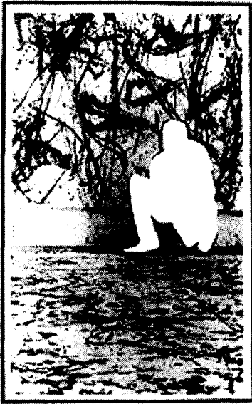
사진 4. 「흰색의 형태」, 1984, 121.9×73.7cm 흑백 사진 위에 아크릴릭

아니라, 무언가 정체를 알 수 없는 공포스러운 기의이다. 지금까지 주체도 객체도 아닌, 동시에 양자(兩者)라고 하는 객관적인 경계로 들어가서 그곳에서 밖에는 감지할 수 없는 것을 하나의 징표로서 신체화 시키고, 우리들이 어떤 문화적 환경이나 사회적 상황에 정주해 버렸는지를 알려 준다. 처음부터 아버지가 없는 사생아이며, 어머니가 있기는 하지만, 그 어머니는 부재 한다는 것만을 알리는 미디어 마더(media mother)로 해석된다[16].