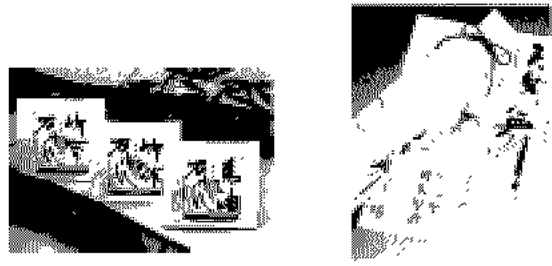
【그래픽에 활용 예시】

국가인 일본과 중국 그리고 서구에서까지도 자연적이고 감성적인 캘리그래피적 표현들이 디자인의 전반에 걸쳐 보여지고 있다. <그림참고>