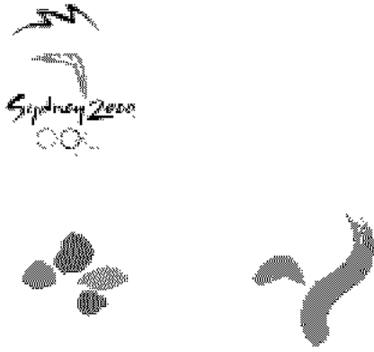
【브랜드 마크에 활용예시】