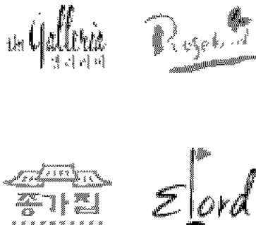
【브랜드 로고타입에 활용예시】

우수한 브랜드 로고를 개발하기 위하여 디자인의 주목성이나 가독성, 제품이미지와와의 부합여부, 독특한 미적 감각, 개성, 현대적 감각, 소비자에 대한 문자 자체의 친근감 등이 내포되어야 한다. 캘리그래피기법의 활용 가능성을 암시하고 있다고 보여진다. <아래 그림참고>