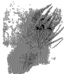
한스 아르프 작 -1954