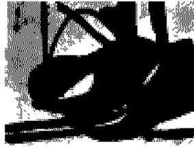
프란츠 클라인 작 -1950