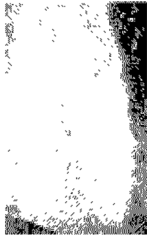
마크 토비 작 -1953

우 엄정해 보이거나 그것이 결코 어떤 주어진 주제에서 시작하고 있지는 않는 것으로 보인다.》 <그림참고>