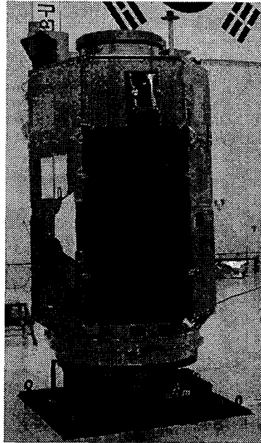
그림 2. 다목적 실용위성 2호 질량특성 측정 - 수직축.

질량특성 데이터베이스는 위성을 구성하는 모든 요소에 대한 질량값 및 위성 좌표계에서의 위치 값을 MS/EXCEL에 입력하여 전체질량 및 질량중심 그리고 관성 모멘트 값을 계산한 것으로 전체 질량이나 질량중심 값은 산술적으로 정확하게 계산되지만 관성 모멘트 값은 모든 요소의 자체 관성 모멘트를 정확하게 계산할 수가 없어 어느 정도의 오차가 생기는 것은 불가피한 실정이다. 그러므로 주요 구조부재 또는 장착장비의 자체 관성모멘트를 예측하는 신뢰도 있는 방법이 필요하다. 다목적 실용위성 2호의 구조·열 모델을 구성하는 주요 요소에 대한 자체 관성모멘트 계산은 앞서 나온 계산