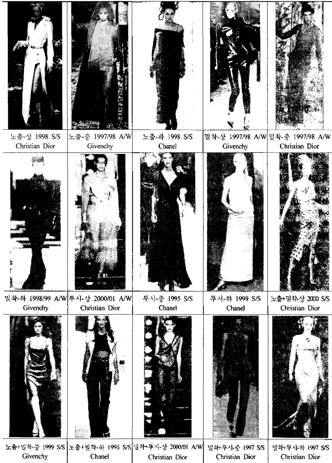
〈표 7〉 표현방법과 표현수준에 따른 에로티시즘의 범주화