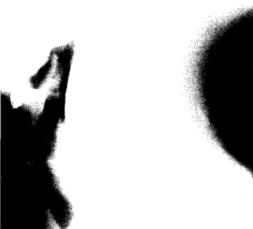
Fig 3. Postoperative(17th day) lateral neck plain X-ray shows much decreased swelling of posterior pharyngeal wall