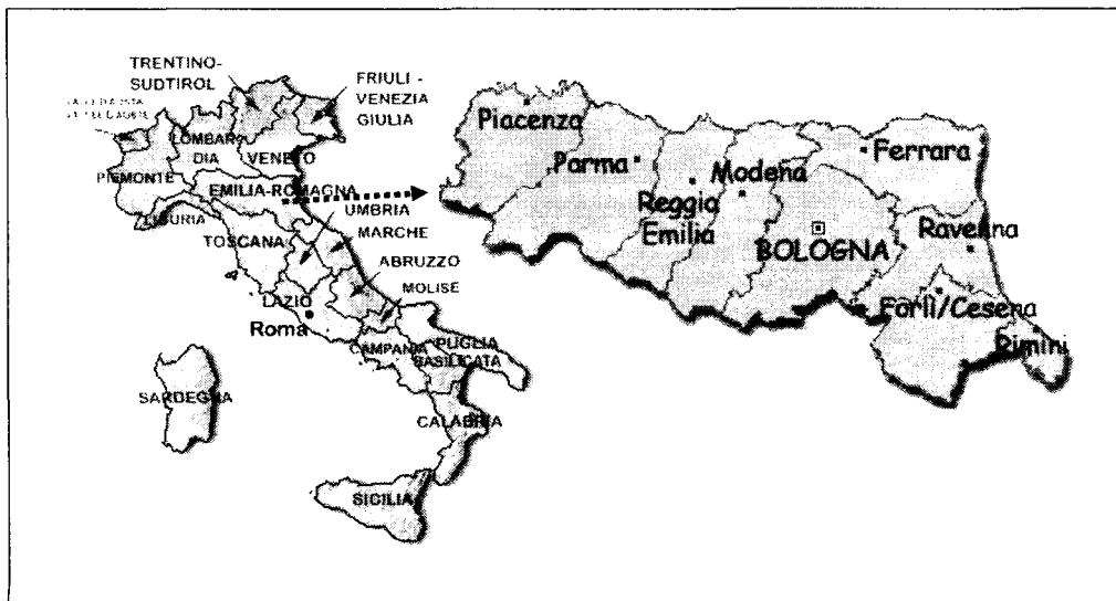
그림 1. 에밀리아 로마냐의 지리적 위치

에밀리아 로마냐 지역은 1인당 GDP가 약 25,000유로 정도로서 이탈리아 국내총생산액의 10%와 총수출의 12%를 담당하고 있다. 지난 5년 동안의 지역 공산품 수출 성장률은 45%, 서비스 수출은 성장률은 52.4%였다. 이 기간의 수