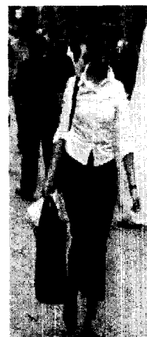
<사진 6> 셔츠와 면바지, 밀라노 via vitt.em, 2002. 5

밀라노의 거리에서 보이는 이지 캐주얼 룩은 청바지나 면바지의 하의에 티셔츠, 점퍼 등 우리나라와 아이템의 조합은 같으나, 실루엣 면에서는 좀 더 몸매를 강조하는 바디 컨셔스 스타일이 지배적이다. 이렇게 바디 컨셔스 실루엣은 모든 스타일의 의상에서 이탈리아 여성들의 자기표현 방식의 기본적인 스타일로 자리잡고 있으며, 평범함 속에서도 자연스러운 실루엣 연출을 통한 개성표현 방법으로 나타났다.(사진 6).