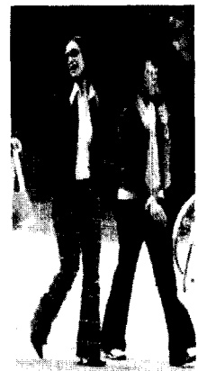
<사진 8> 재구성 데님 바지, 밀라노 San Babila, 2002. 4

밀라노 거리의 젊은이들에게서 가장 많이 보이는 것이 데님 룩이다. 이탈리아의 젊은이들은 남녀 거의 대부분 데님을 기본 의복으로 착용하고 있다. 데님은 리폼을 거치고 나면 독특하고 세련된 스타일을 연출할 수 있는 기본 아이템이기 때문에 특히 젊은이들에게 시대를 초월해서 사랑 받고 있다. 밀라노에 나타난 대부분의 데님 룩은 몸에 꼭 맞는 바디 컨서스 스타일이며, 정리하지 않은 솔기와 여러 가지 방법