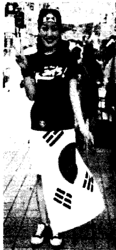
<사진 3> 태극기 스커트와 붉은악마 티셔츠, 서울 명동, 2002. 6

<사진 3>은 태극기와 함께 대한민국의 국민 유니폼으로 자리한 붉은 악마 티셔츠로서 역시 청바지나 반바지, 태극기 등과 함께 착용하여 국민간의 동질감을 표현하였다. 우리나라의 축구복 스타일 캐주얼은 그 동안 경건함과 권위의 상징이었던 태극기와 부정적인 이미지를 가지고 있던 붉은 색의 붉은 악마 티셔츠, 우리나라 대표팀의 국가대표 유니폼을 중심으로 한 다양한 코디네이션을 통한 개성 표현으로 큰 인기를 끌었다.