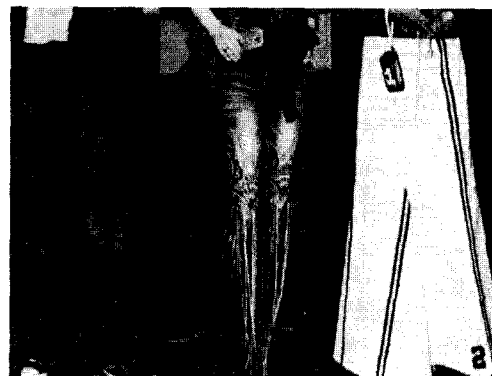
<사진 12> 재구성된 바지들, 서울, Vogue girl, 2002. 8

우리나라의 클럽 문화는 몇 년 전만 해도 흥대 앞을 중심으로 한 언더 그라운드 인디 밴드와 소수 팬들의 전유물 같았으나, 서서히 그 영역을 넓혀가고 있다.