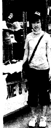
<사진 1> 스포츠 브랜드 로고 티셔츠, 서울 이대앞, 2002.6

겨울에는 가볍고 따뜻한 착용감으로 젊은이들이 많이 착용하는 여유 있는 패딩 점퍼를 통해서 편안함과 활동성을 동시에 만족시키는 스포츠 캐주얼의 특성을 선보이고 있다. 이렇게 스포츠 캐주얼의 의복은 운동복에서 출발하였으나, 젊은이들 사이에서는 내적으로나 외적으로 그들의 활동적이고 자유로움을 표현하고, 또래 집단의 결속력을 나타낼 수 있는 의복 스타일로 널리 착용되고 있다.