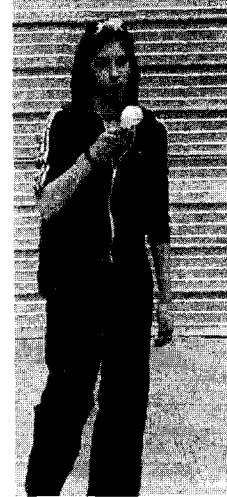
<사진 2> 아디다스 3선 점퍼, 밀라노 via.vitt.em, 2002.5