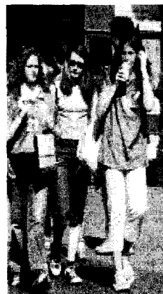
<사진 4> 축구 국가대표 유니폼, 밀라노, via vitt em, 2002. 6

이탈리아에서는 전통적으로 축구가 가장 인기 있는 스포츠 종목으로서, 이탈리아 국민에게 축구는 국기(國技)라고 할 수 있다. <사진 4>는 이탈리아 국가대표 팀의 유니폼을 착용하고 있는 젊은이들의 모습으로서 가장 일반적인 축구 응원복의 한 형태라 할 수 있다. 이를 통해 이탈리아에서도 국기와 유니폼을 통해 자국 팀을 응원하는 것을 알 수 있다. 그러나 이번 월드컵에서 이탈리아가 기대했던