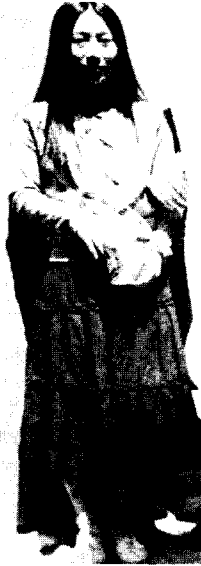
<사진 10> 꽃 문양 카디건과 스타킹, 서울 명동, 2002. 4

이렇게 서울의 젊은 여성들은 히피의 자유분방하고 꾸미지 않은 듯한 거친 모습보다는, 귀엽고 여성스러운 스타일을 표현하기 위해 히피 스타일 로맨틱 룩을 착용하고 있으며, 젊은이다운 활동성과 편안함을 강조하기 위해 스니커즈 등의 스포티즘적 요소를 첨가하고 있다.