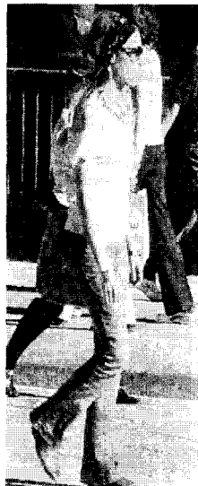
<사진 11> 프릴 블라우스, 밀라노 via vitt.em, 2002. 6

이렇게 밀라노의 거리에서는 좀 더 성숙하고 섹시한 여성미와 개성적인 로맨틱 히피 스타일이 주로 보이고 있다. 이를 통해