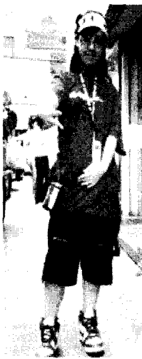
<사진 9> 힙합 바지, 티셔츠 서울 이대 앞 2002. 6

이탈리아에서는 의류의 스타일과 아이템, 자신의 몸매와는 관계없이 전체적으로 인체를 강조하는 바디 컨서스 실루엣의 특징을 지니고 있기 때문에, 밀라노 거리의 젊은 여성들 사이에서는 빅 사이즈의 의복을 통해 인체를 과장하는 힙합 데님 룩이 거의 보이지 않고 있다. 간혹 힙합 스타일의 의복을 착용한 여성도 상, 하 가운데 한 부분만 힙합 스타일로 착용했을 뿐 상·하의 모두를 힙합 스타