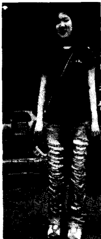
<사진 7> 찢은 데님바지, 서울 압구정동, 청담동, 2002. 6

기성복을 지루하게 여기던 젊은이들은 자신이 갖고 있는 옷을 찢고, 잘라내며 글씨를 써넣어서 자신만의 독창적인 의상을 창조하게 되었다. 7) 사회에 대한 강력한 반발 의식을 복식에 투영하면서 기존의 미의식을 탈피한 스트리트 패션의 안티(anti)적 감각은 개성적이고 대담한 방식으로 매우 다양하게 나타났다. 8) 최근에 등장한 리폼 데님은 지저분하고 파괴적이고 거친 리폼 이미지와 함께 귀엽고, 여성스럽고, 재미있는 등의 여러 가지 요소들이 첨가된 다양한 이미지가 재창조된 형태로 나타나고 있다.